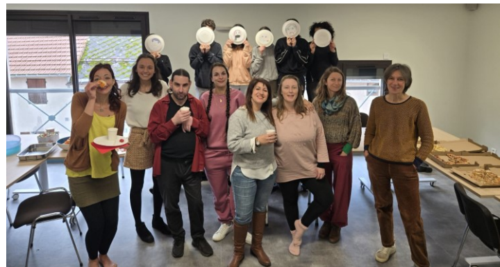
Repas partagé entre administrateurs, bénévoles et adolescents à l'occasion du Salon du Livre et de la formation dynamique coopérative