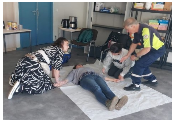
Formation « sauveteur secouriste au travail »

En 2025, elles ont bénéficié de deux formations en local : sauveteur secouriste et connaissances sur le développement du cerveau de l'enfant en lien avec les derniers apports des neurosciences.