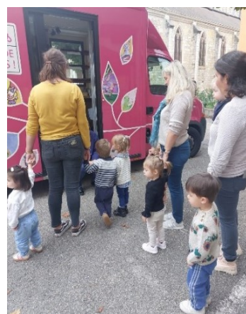
Venue du Bibliobus

Des intervenants enrichissent ponctuellement ces temps d'accueil d'apports pédagogiques spécifiques : exploration sensorielle, psychomotricité etc., ou plus régulièrement : partenariat autour de la lecture avec la Médiathèque du