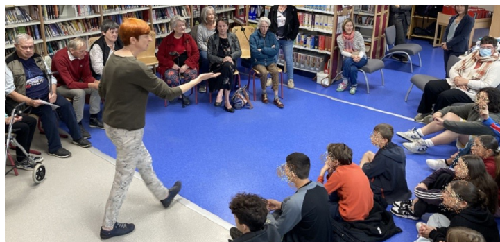
Au collège avec les 4 èmes , les résidents de l'EHPAD et la Compagnie L'Oiseau Blanc en octobre pendant la Semaine Bleue

En 2026, Ain'terlude-en-Bugey proposera des actions en direction de tous ses publics. Les familles, les enfants, les adolescents pourront bénéficier d'animations variées proposées par des bénévoles et salariés de l'association ou des intervenants.