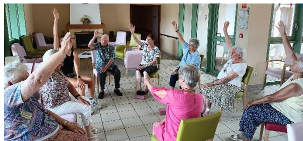
Yoga sur chaise

mobilité: regagner souplesse et force musculaire, retrouver mobilité et autonomie, (re)gagner confiance en soi améliorer son capital santé.