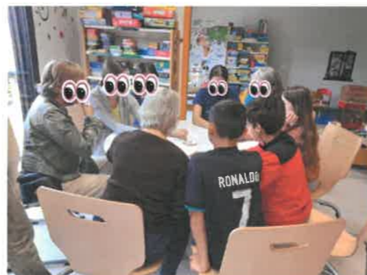
Jeu Dobble entre ados et résidents de l'EHPAD

Nos grands ados, ou jeunes adultes, préparent de belles soirées jeux. Ils seront accompagnés dans leur projet par plusieurs bénévoles.