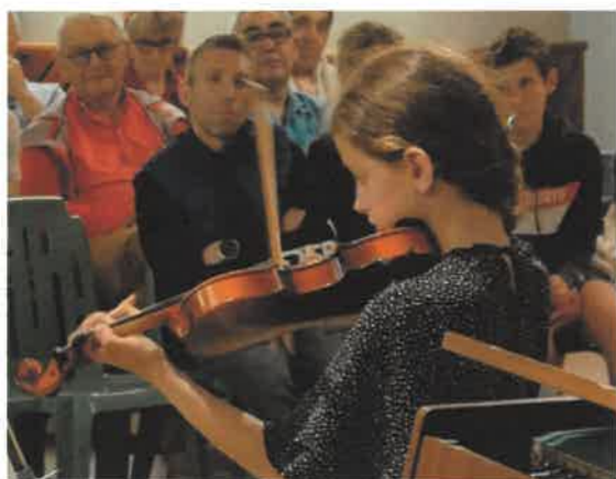
Fête de la Musique 22/06/2024

Au printemps , ce sont les écoles primaires du Valromey qui bénéficieront à nouveau d'un projet de pratique instrumentale collective autour du chant, du violon, de la guitare, du balafon et de la darbouka, avec trois enseignants de Val'Muse et deux intervenants de l'orchestre d'enfants du monde « Pequenas Huellas ».