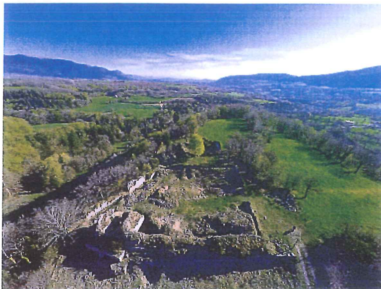
Photo aérienne par Mathieu Terzian pour le Cercle Amical de Songieu

bg@archivesmultimedia.com / 06 08 87 17 40.