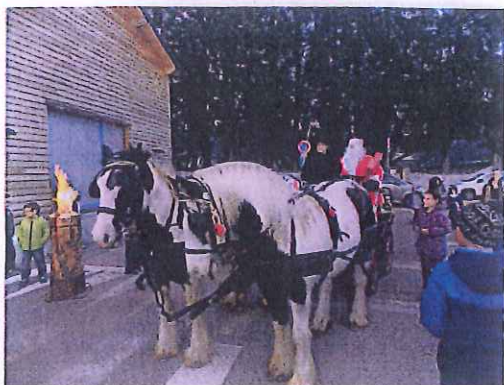
L'arrivée du Père Noël en calèche

73 enfants ont bénéficié de la venue du Père Noël en calèche cette année, faute de neige, en recevant de ses mains un cadeau. Une collation autour des brûlots a été servie pour l'occasion par la commission sociale, avec des spécialités apportées par les familles des enfants.