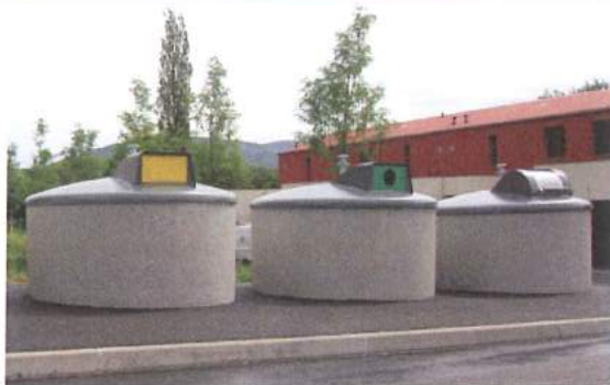
Voilà à quoi ressemblera un point d'apport volontaire